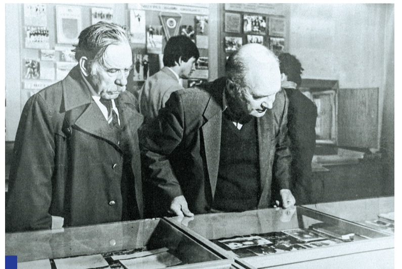
Племянник Валериана Куйбышева, имя которого когда-то носил Политех, с интересом отнёсся к музейной экспозиции.