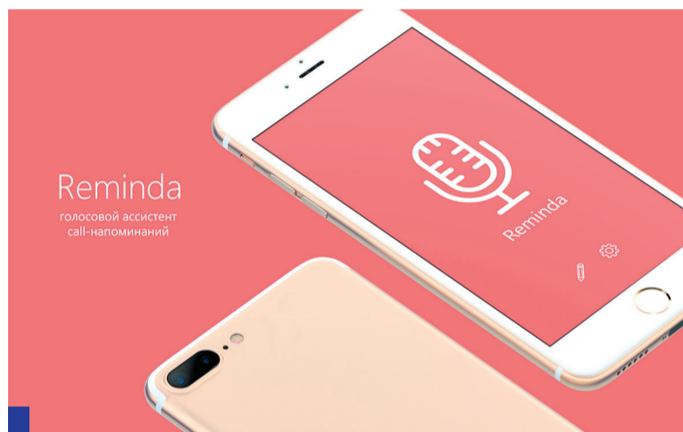
Вот так будет выглядеть дизайн мобильного приложения Reminda для iPhone.

время вам позвонят на телефон и приятный голос скажет о предстоящем событии. Обычно люди быстрее реагируют на звонки, чем на письменное уведомление.