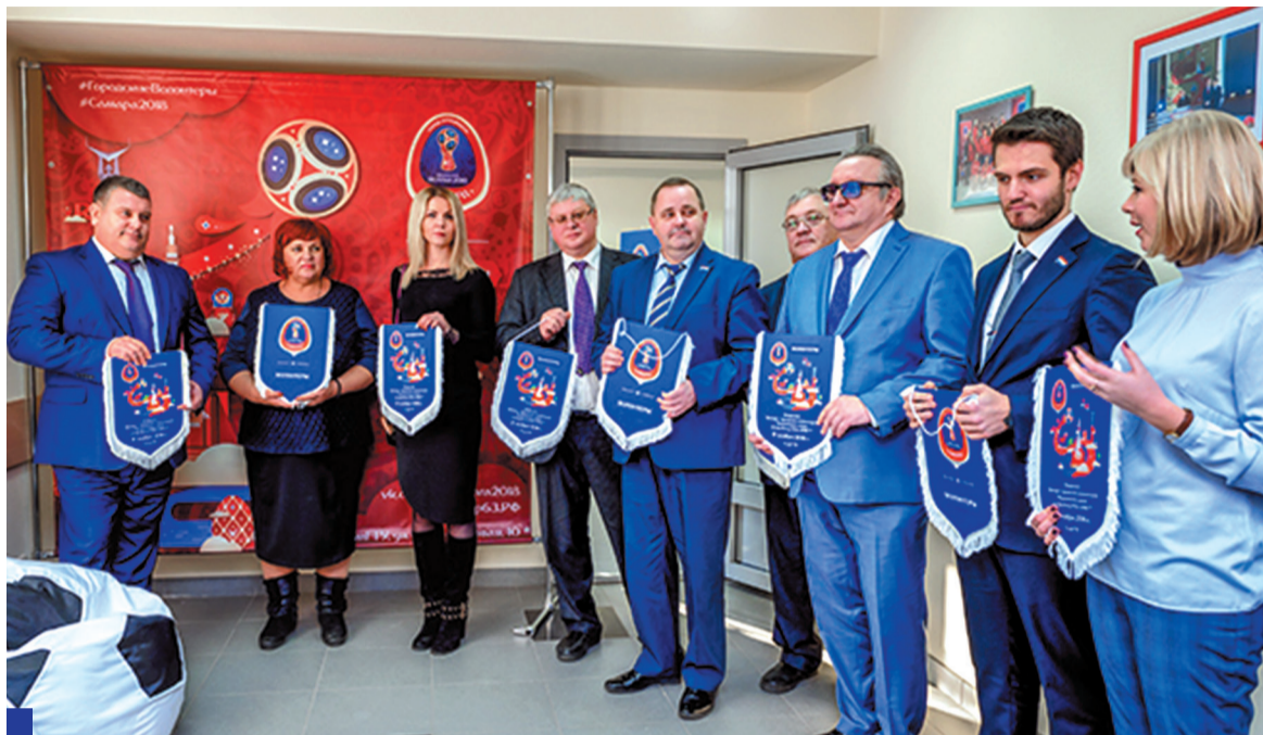
Открытие Центра городских волонтеров стало значимым событием для Самары.