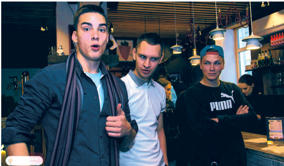
В кастинге участвовали самые талантливые и активные студенты.