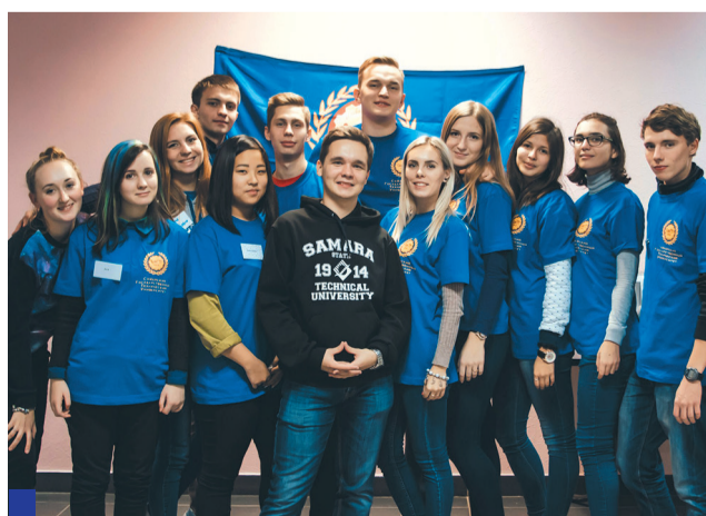
Сегодня они работают в студсовете, а завтра, возможно, встанут у штурвала власти.

У общественной организации много целей и задач. Прежде всего это работа с первокурсниками, для которых студсовет является своего рода проводником в студенческую жизнь, а также разносторонняя проектная деятельность – организация мероприятий развлекательного и образовательного характера. Члены студенческого совета представляют интересы студентов на учёных советах как факультетов, так и всего университета, отстаивают права студентов на дисциплинарных комиссиях и комиссиях по переводу на бюджет, выдвигают достойных кандидатов на получение мест в общежитиях, льгот и путёвок.