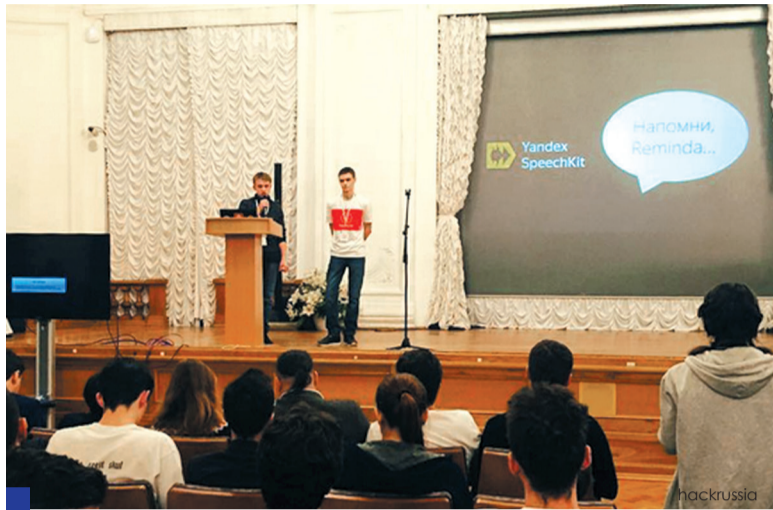
Студенты ФАИТ смогли за три минуты рассказать о преимуществах своего изобретения.

Разработка студентов ФАИТ поможет пользователям не забыть о важном