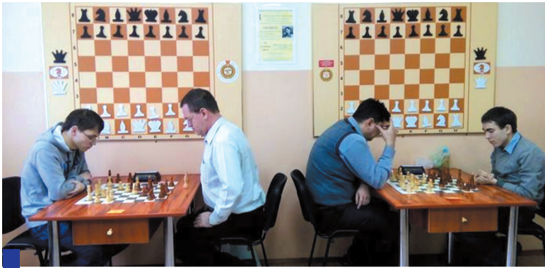
Из-за многочисленности участников турнир проходил не только в помещении шахматного клуба, но и в столовой 8-го корпуса.