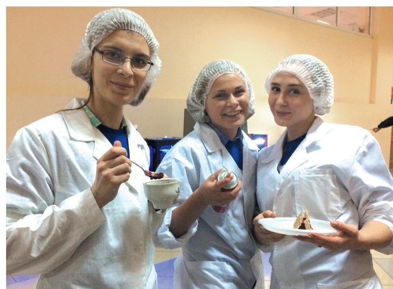
Вафли политеховцев подавались с фруктовым соусом.

Ну а программа фестиваля не ограничилась проектной деятельностью. Для студентов провели экскурсию по Кубанскому университету, на которой они познакомились с технологиями 3D-печати, робототехникой и другими интересными вещами, а также мастер-классы по интересам.